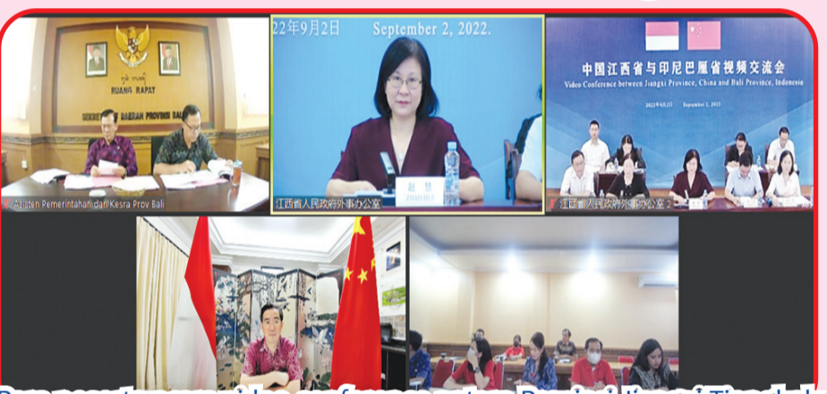
Para peserta acara video conference antara Provinsi Jiangxi Tiongkok dan Provinsi Bali Indonesia.

Konjen Tiongkok Denpasar juga bersedia berperan sebagai jembatan dan tali penghubung untuk mendorong interaksi dan kerja