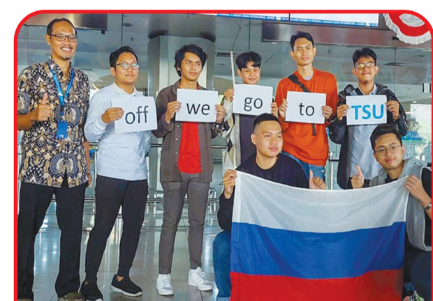
Sebagian mahasiswa yang dikirim ke ke Tomsk State University, Rusia

"Tak hanya itu, dengan mencicipi eksposur internasional yang ada, diharapkan bisa memberi motivasi bagi mahasiswa lainnya. "Dengan membagikan pengalaman selama di Rusia, tentu mereka dapat memberikan pengetahuan baru bagi mahasiswa lain," pungkasnya. • anto tze