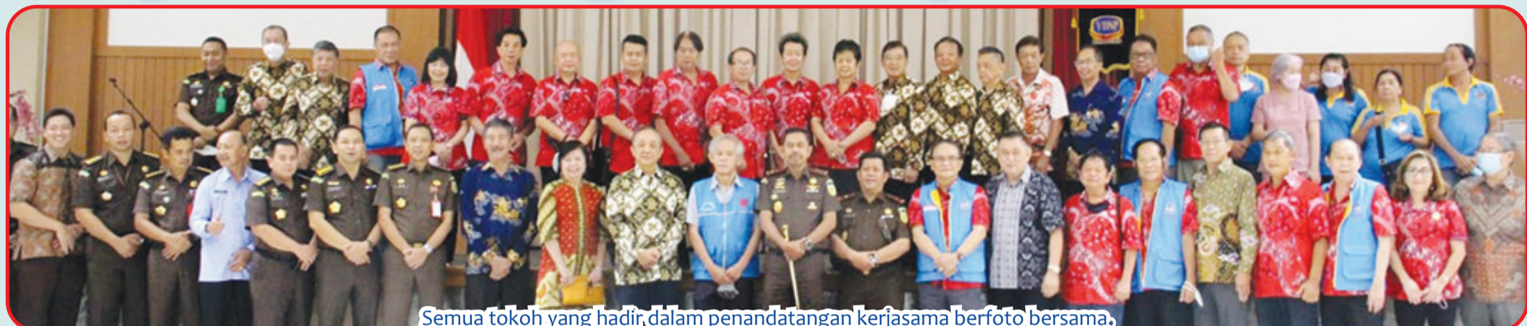
Semua tokoh yang hadir dalam penandatanganan kerjasama berfoto bersama.

BANDUNG (IM) - PSMTI (Paguyuban Sosial Marga Tionghoa Indonesia) Jawa Barat, Selasa (30/8) lalu menandatangani kesepakatan kerja sama dengan Persaja (Persatuan Jaksas Indonesia) Jawa Barat di kantor sekretariat YDSP Bandung.