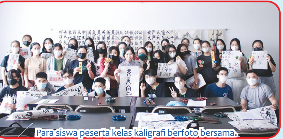
Para siswa peserta kelas kaligrafi berfoto bersama.

Sambil menjelaskan budaya Riasan Wajah Opera Peking, ia mengajarkan kosakata warna Tionghoa dan sekaligus menjelaskan ko-